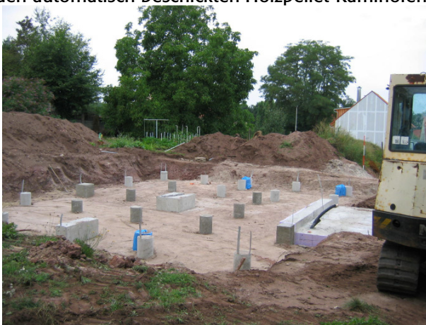
Sind wir denn in der Steinzeit? Die Pfähle, auf welche das Haus gestellt wird sehen ungewohnt aus, bilden aber ein Fundament für die Holzelementdecke mit guter Dämmung – und damit Behaglichkeit und niedrigen Energieverbrauch: Das Haus erfüllt die strengen Anforderungen der KfW als Energiesparhaus

HOLZBAUHAUS – Systemhaus 2 mit Anbau für Haustechnik und Hauswirtschaftsraum. Das Pelletlager für den automatisch beschickten Holzpellet-Kaminofen befindet sich im Spitzboden.