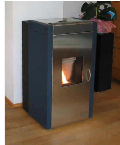
Ein Kaminofen mit Pellet-Betrieb und automatischer Beschickung holt sich die Holzpellet aus einem Lager im Spitzboden.

HOLZBAUHAUS – Systemhaus 2 mit Anbau für Haustechnik und Hauswirtschaftsraum. Das Pelletlager für den automatisch beschickten Holzpellet-Kaminofen befindet sich im Spitzboden.